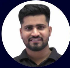
Rahul Sir Science