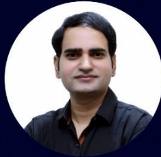
Shahrukh Sir Science