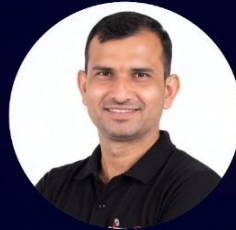
Pankaj Sir Art & Culture