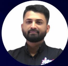
Ratan Sir Rajasthan History