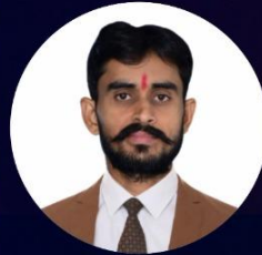
Pushkar Sir Sanskrit