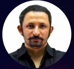
Nagvendra Sir Rajasthan Polity