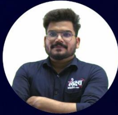
Kunal Sir Psychology